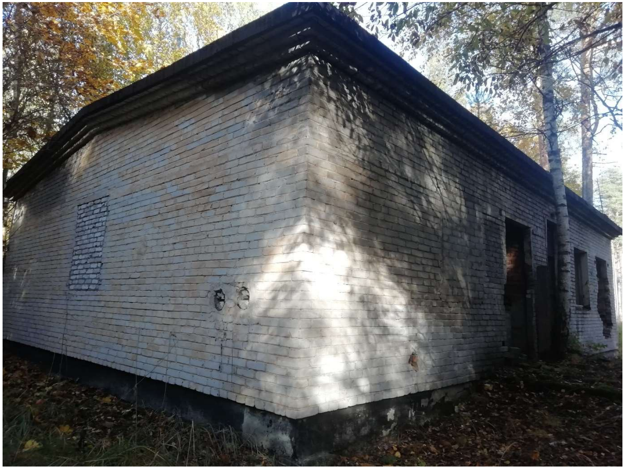
Hoone nr 10 (Vaade hoonele lääne poolt)