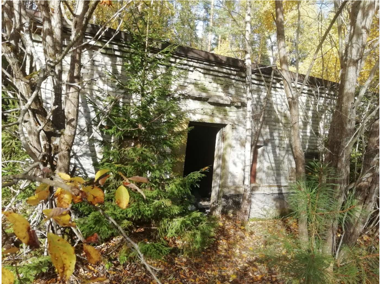
Hoone nr 8 (Vaade hoonele lõuna poolt)