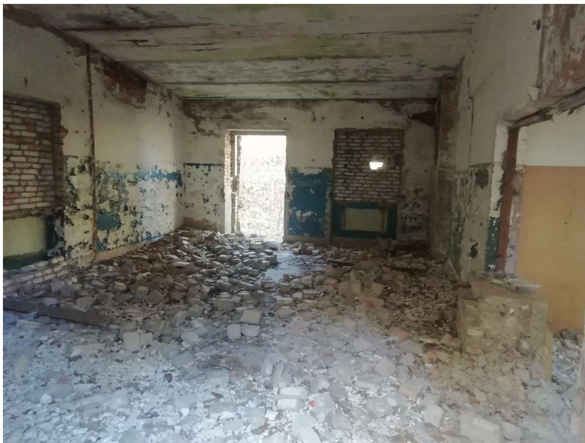
Hoone nr 10 (Vaade hoone sees)