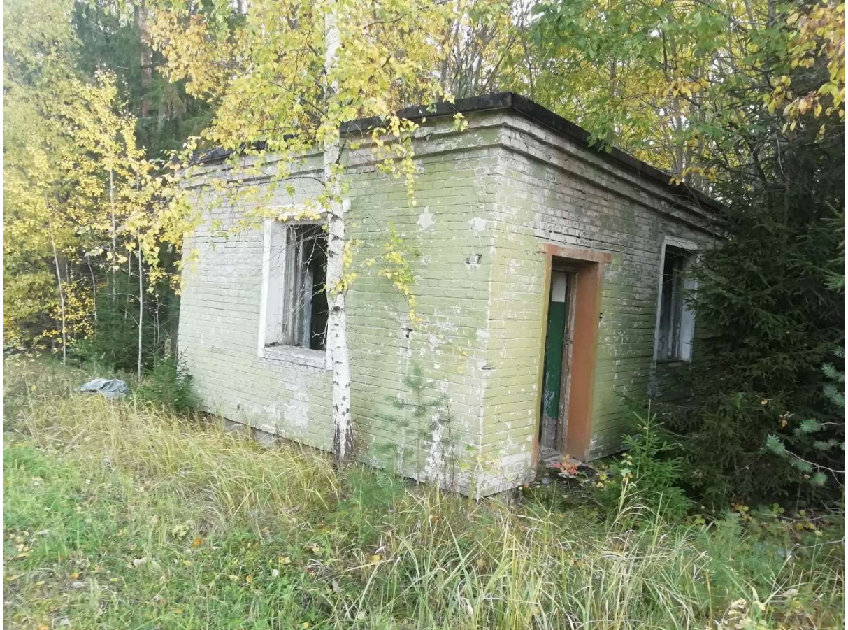
Hoone nr 1 (Vaade põhja poolt.)