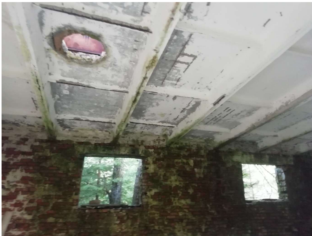
Hoone nr 5 (Vaade hoone sees)