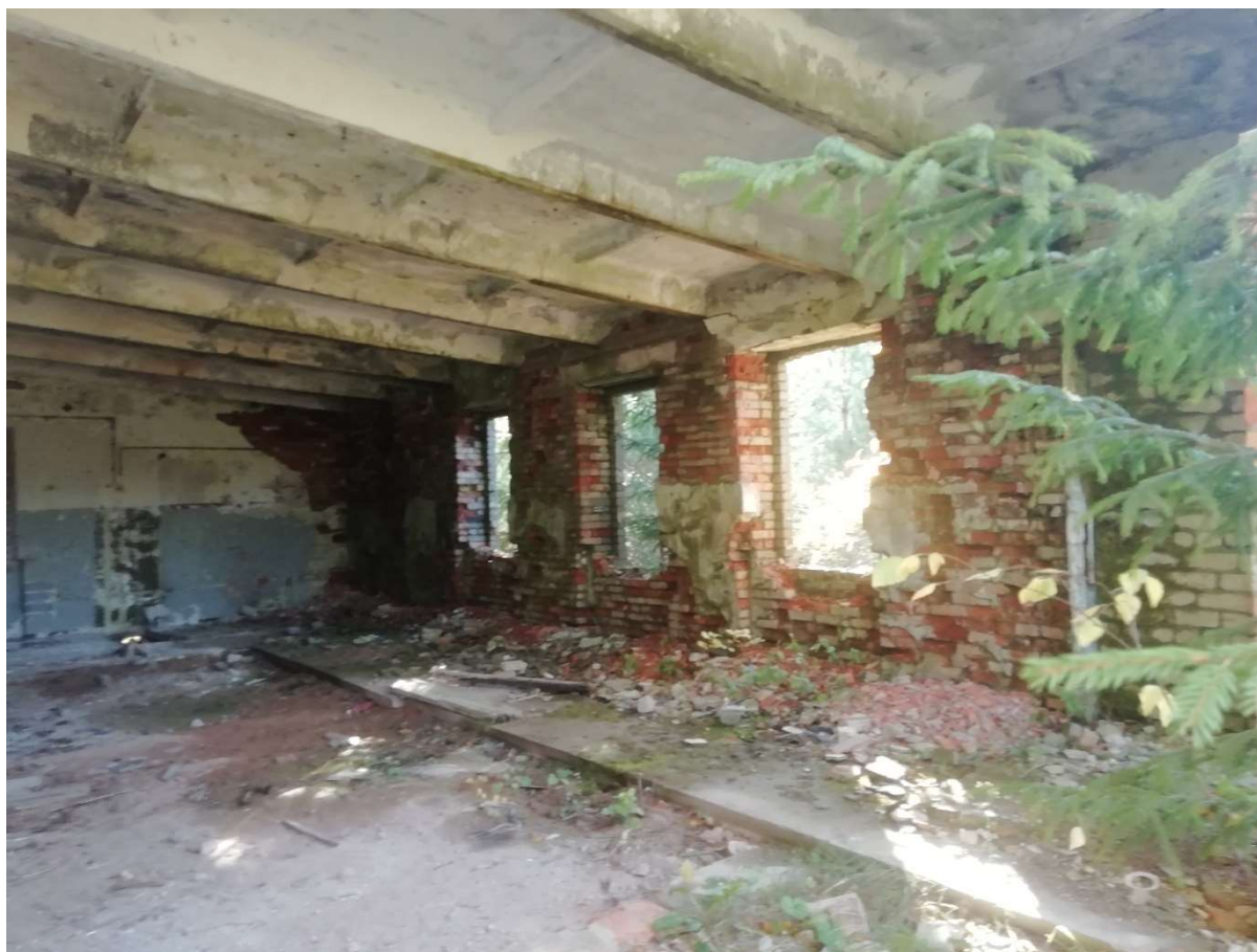
Hoone nr 9 (Vaade hoone sees)