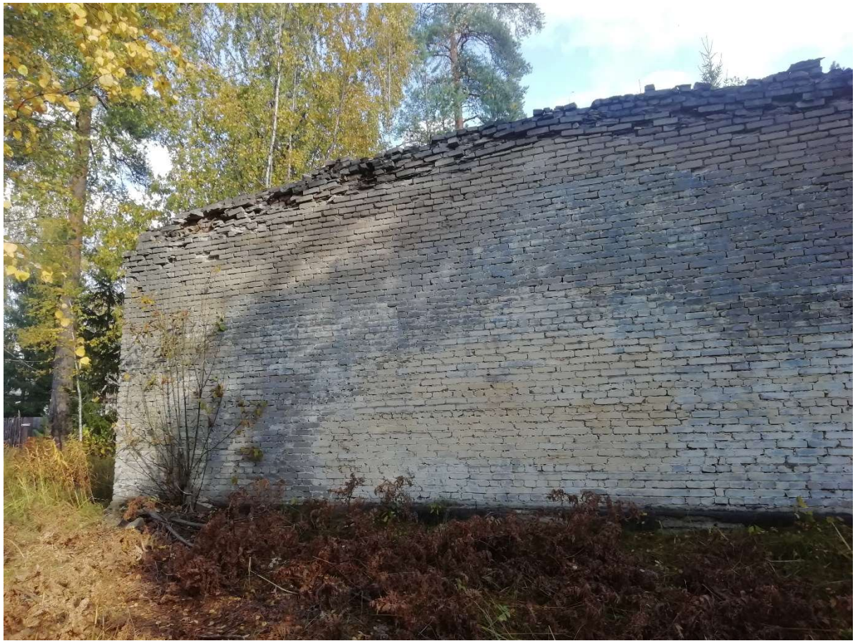
Hoone nr 3 (Vaade läne poolt.)