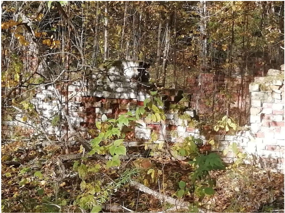
Hoone nr 13 (Ehitise varemed-osaliselt säilinud välisseinad)

NB! Projektis toodud mahud on tinglikud, lammutustööde tegijal tuleb tegelikud mahud täpsustada kohapeal enne pakkumise estamist ning vajadusel mainimata materjalid või töö liik lisada.