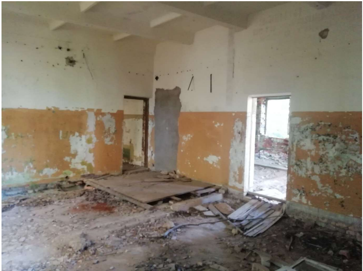
Hoone nr 9 (Vaade hoone sees)