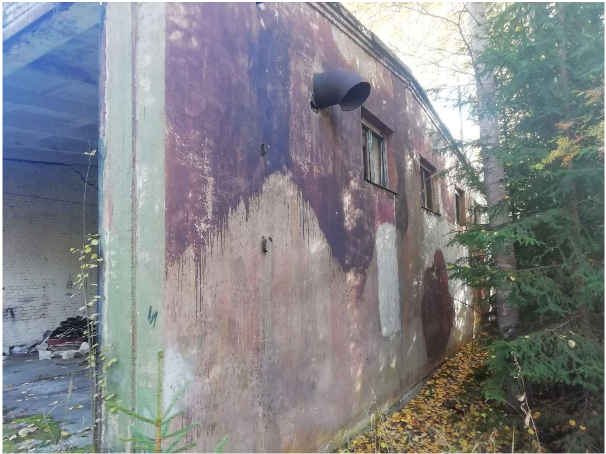
Hoone nr 7 (Lääne poolne külg)