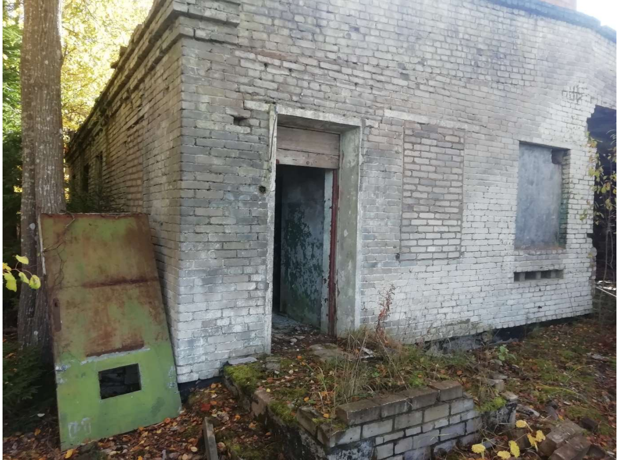
Hoone nr 9 (Vaade hoonele põhja poolt)