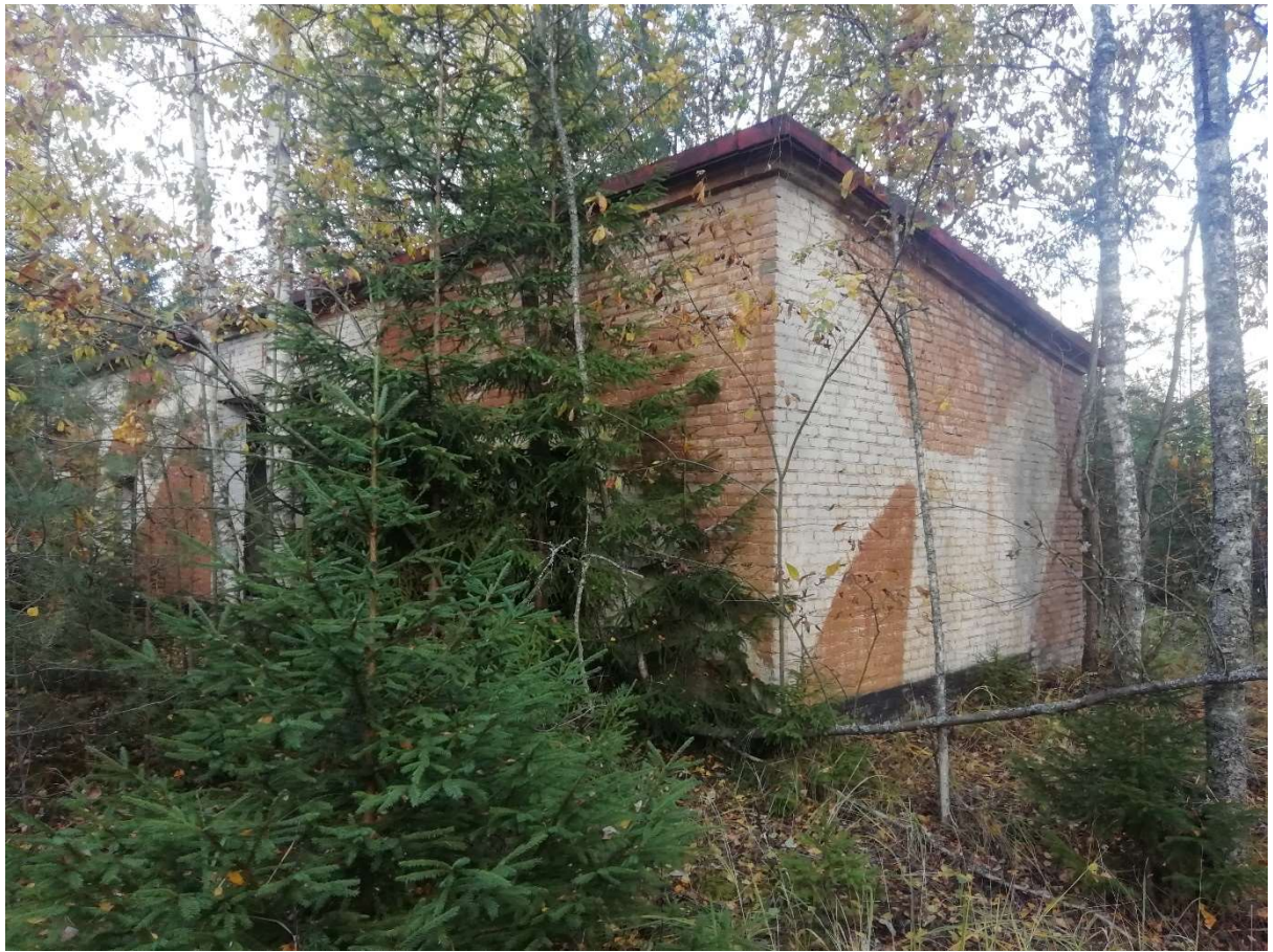
Hoone nr 5 (Vaade lõuna poolt.)