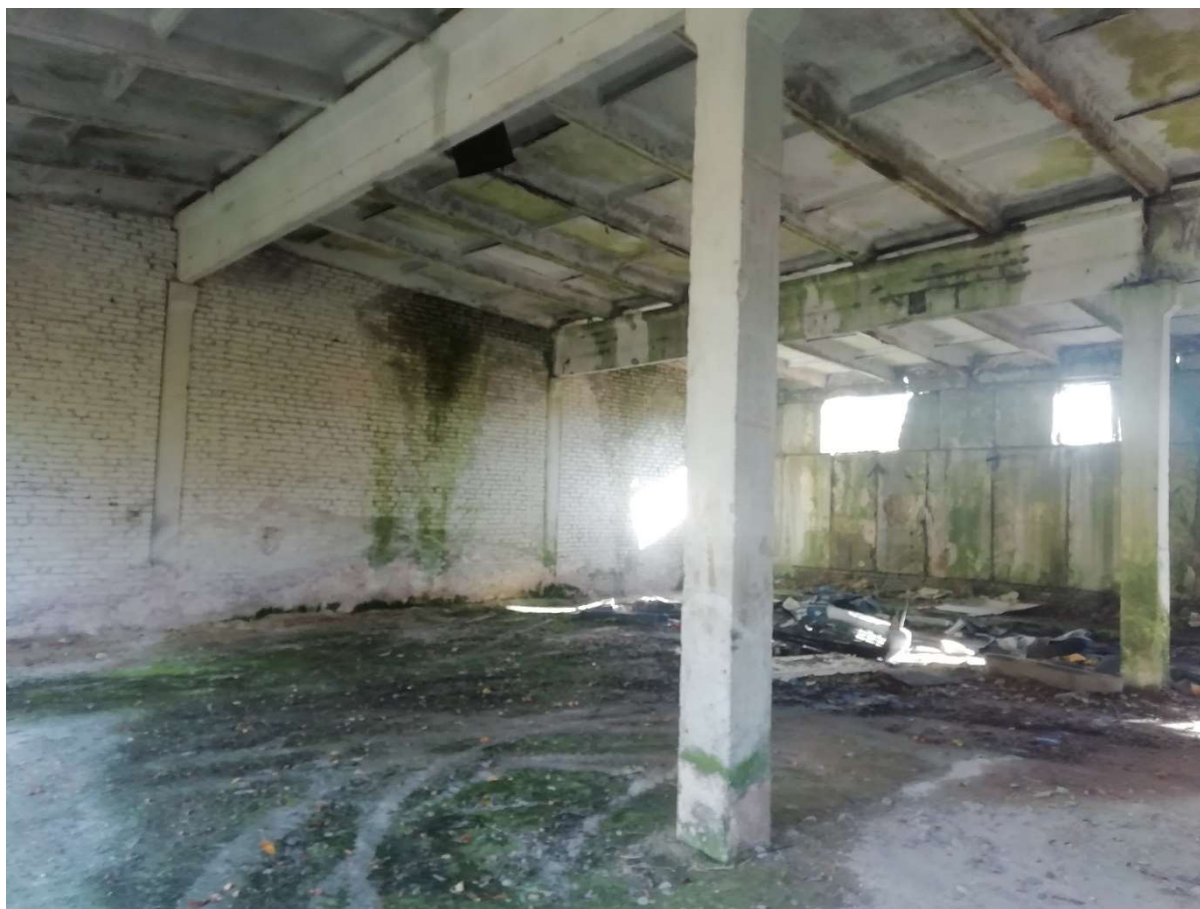
Hoone nr 7 (Vaade hoone sees)