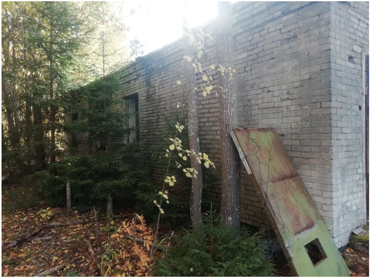
Hoone nr 9 (Vaade hoonele ida poolt)