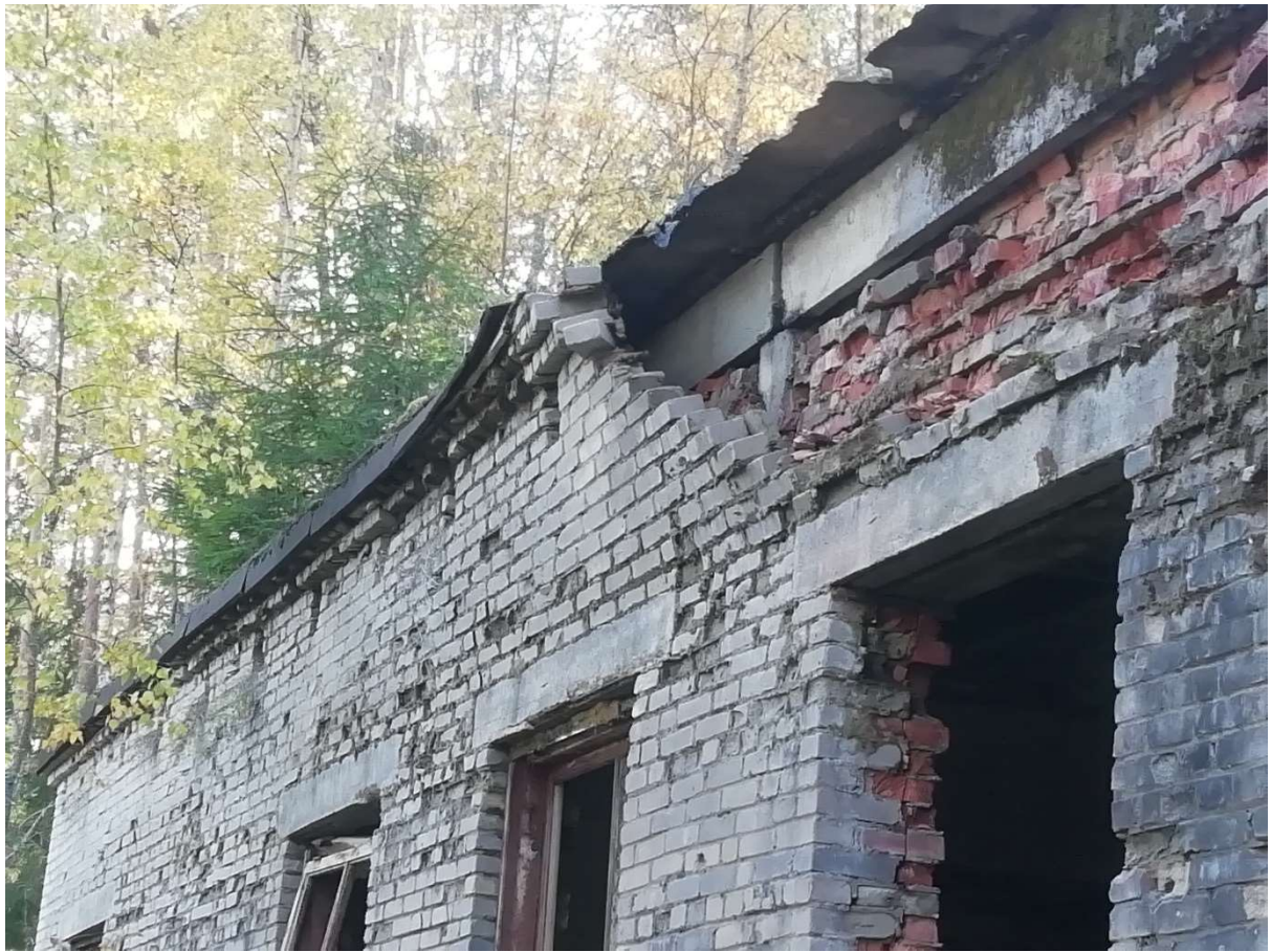
Hoone nr 11 (Maha kukkuv välis vooderdus)