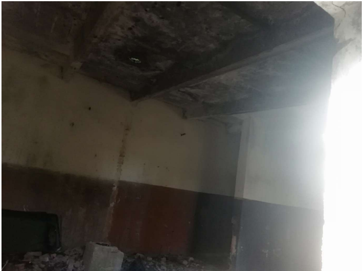
Hoone nr 8 (Vaade hoone sees)