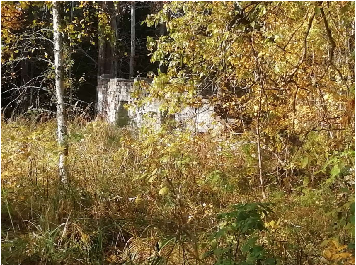
Hoone nr 13 (Vaade hoone varemetel lõuna poolt)