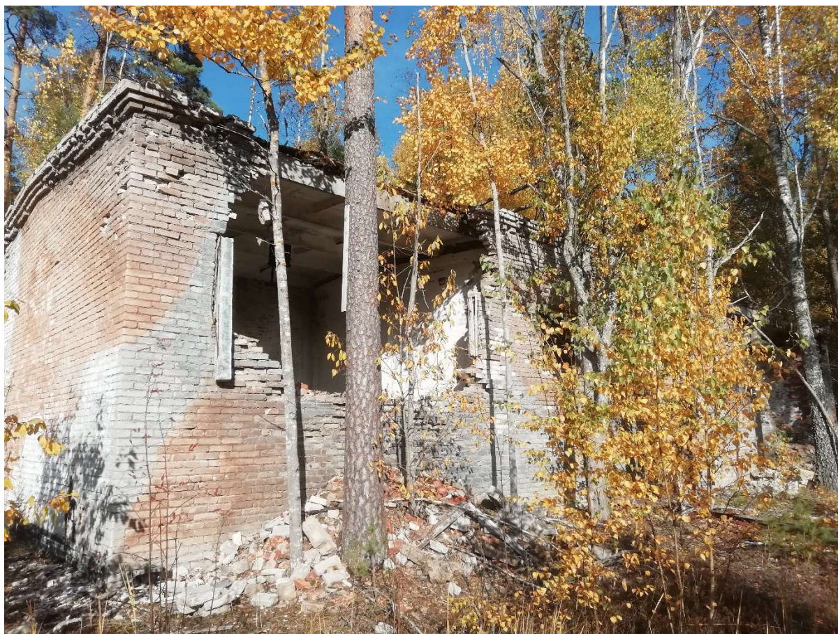
Hoone nr 6 (Vaade lõuna poolt.)