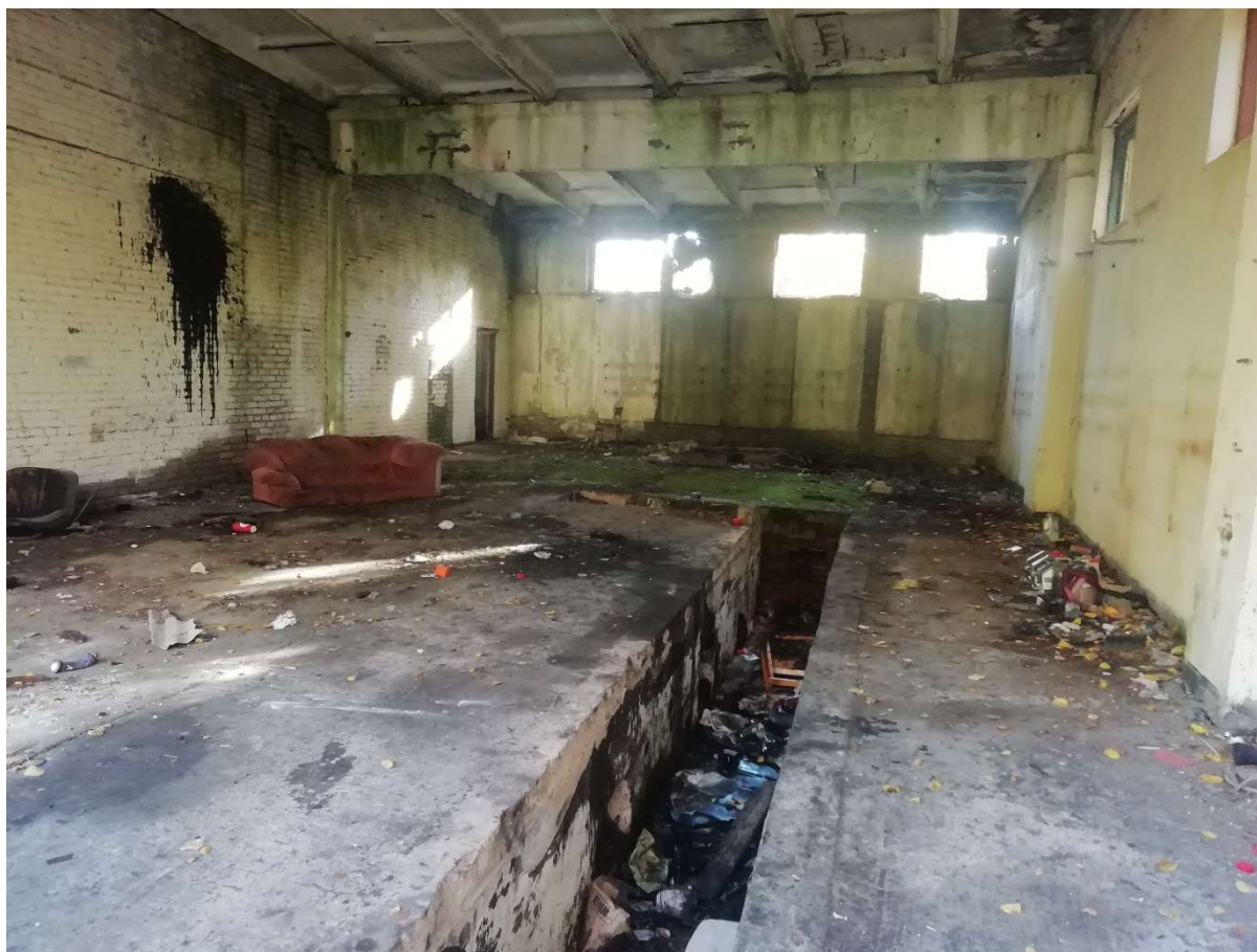
Hoone nr 7 (Vaade hoone sees, viimane sektsioon)