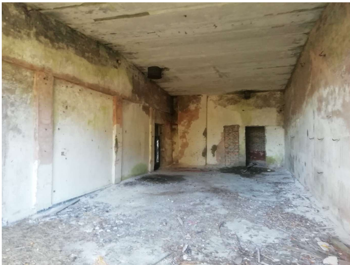
Hoone nr 3 (Vaade hoone sees)