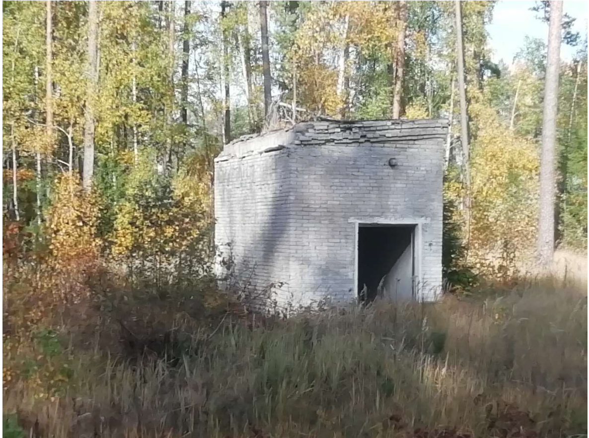
Hoone nr 2 (Vaade lõuna poolt.)