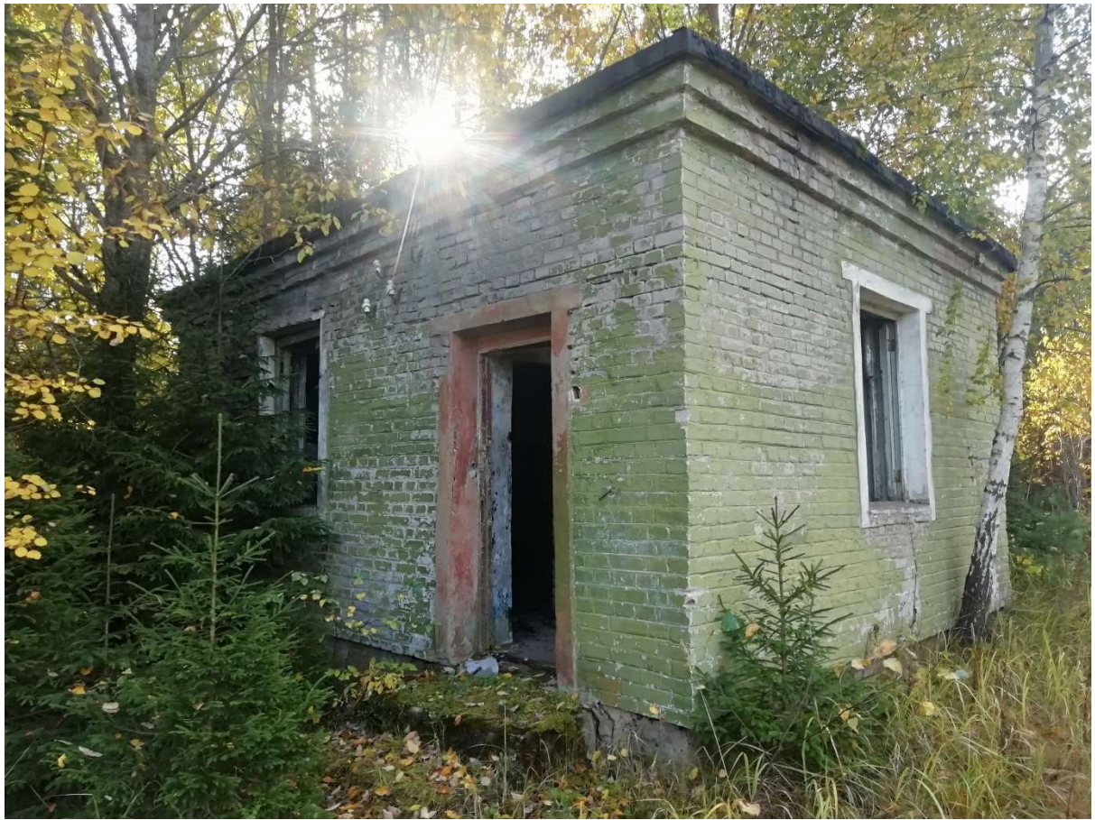
Hoone nr 1 (Vaade ida poolt.)