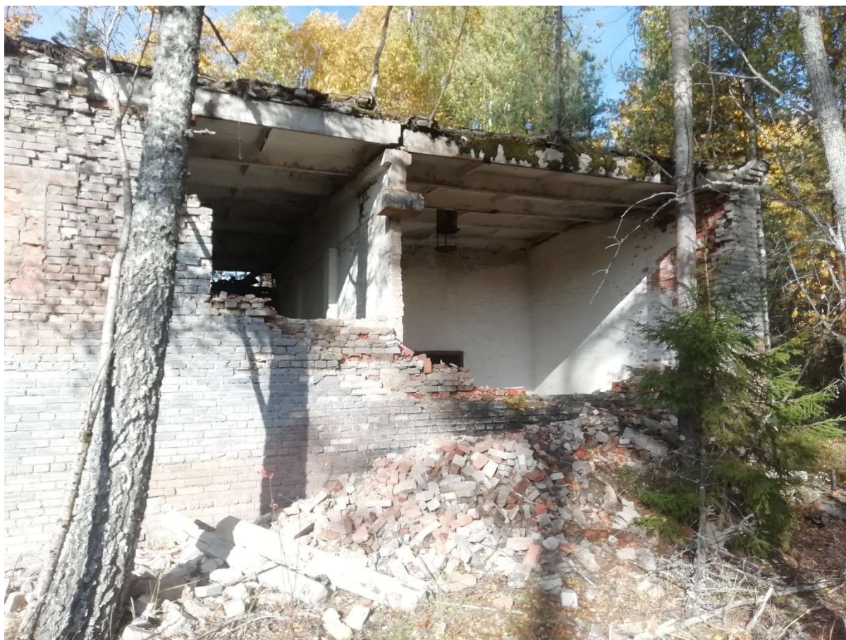
Hoone nr 6 (Vaade lõuna poolt.)