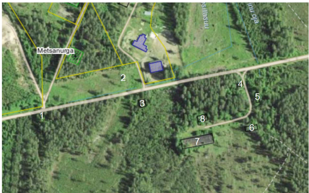
Asendiskeem nr 3 (Lammutatavate hoonete numeratsioon 1-8)

Projekteerimise aluseks on tellija soov lagunevad hooned, varemed ja selle osad maha lammutada, territoorium puhastada ja heakorrastada. Kokku on 13 ehitist, mis tuleb lammutada. Lammutatavad hooned asuvad erinevates kohtades, mis on märgitud asendiskeemidel nr 3, 3.1 ja 3.2. Peaaegu kõik hooned on varisemisohhtlikud. Enamus hooneid on riskujulised ja koosnevad madalvundamendist, kandvatest R/B ja telliskivi konstruktsioonidest, hoonetel on olemas välis ja siseseinad, kui ka R/B katuslaed. Mõned hooned juba kinni kasvanud võsaga ja puudega.