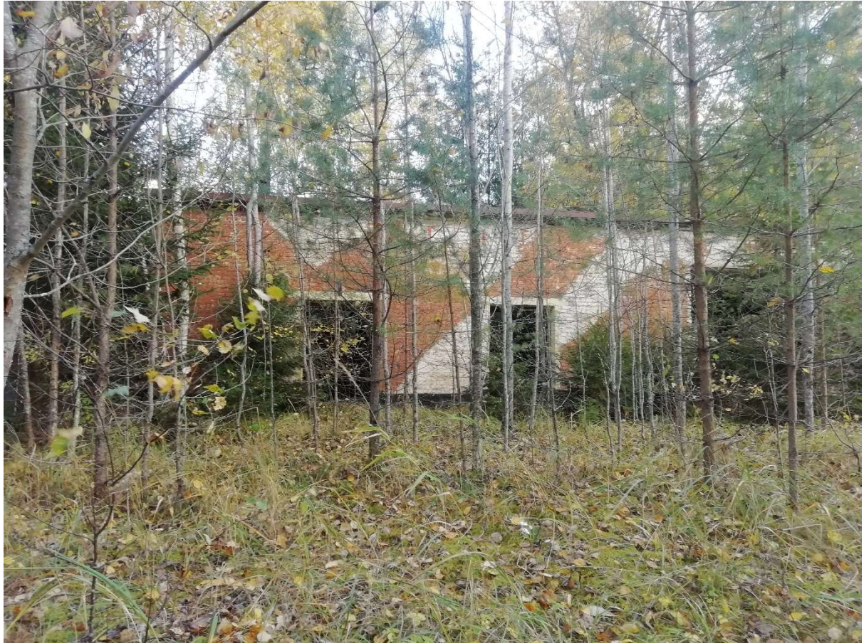
Hoone nr 5 (Vaade lääne poolt.)