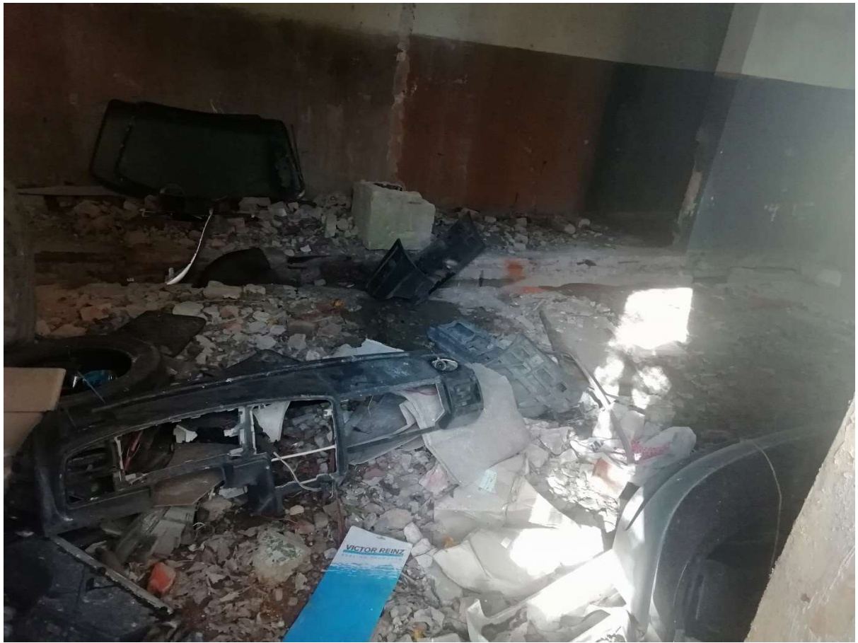
Hoone nr 8 (Hoone sees erineva sorti prügi)