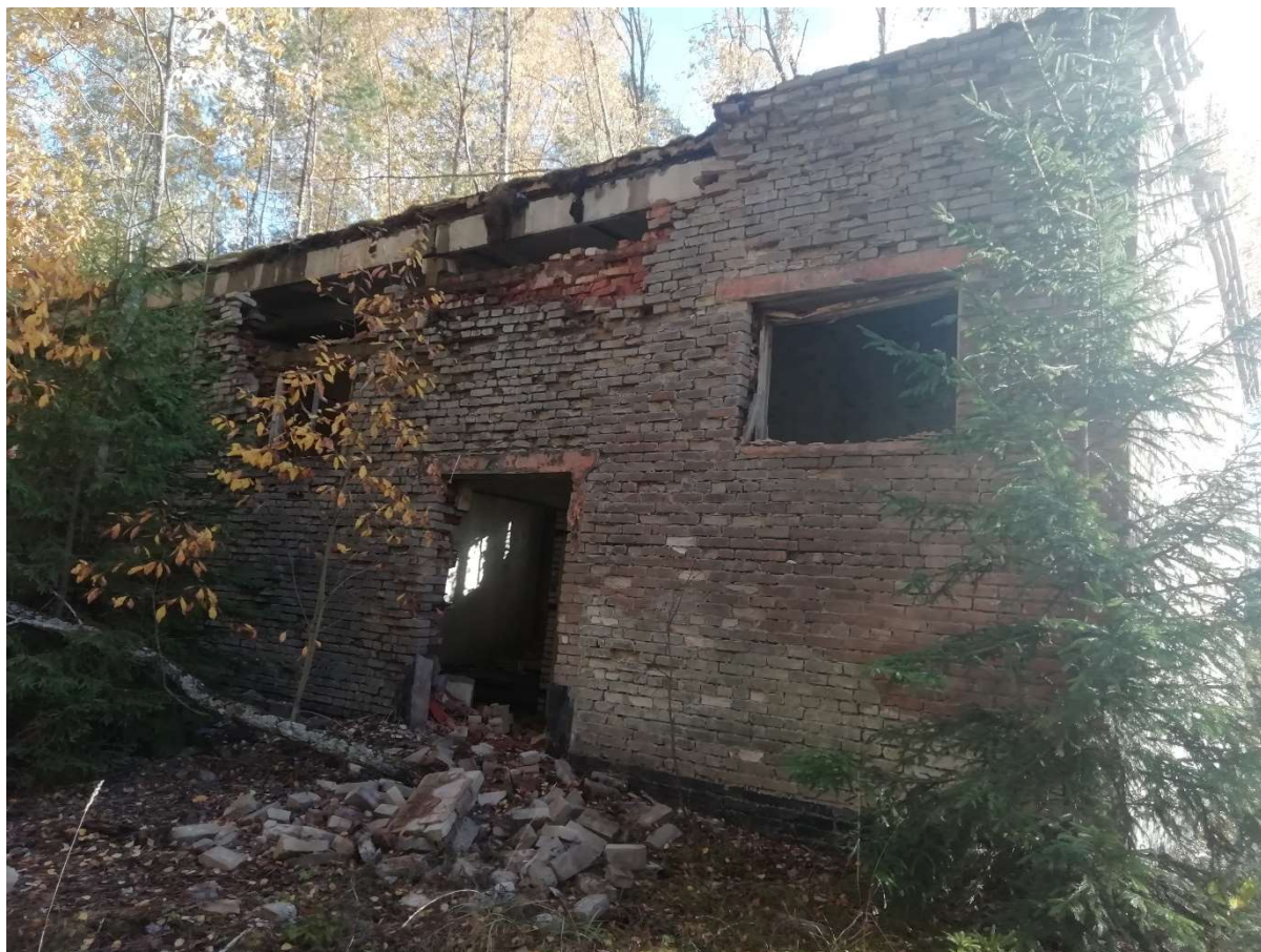
Hoone nr 6 (Vaade põhja poolt.)