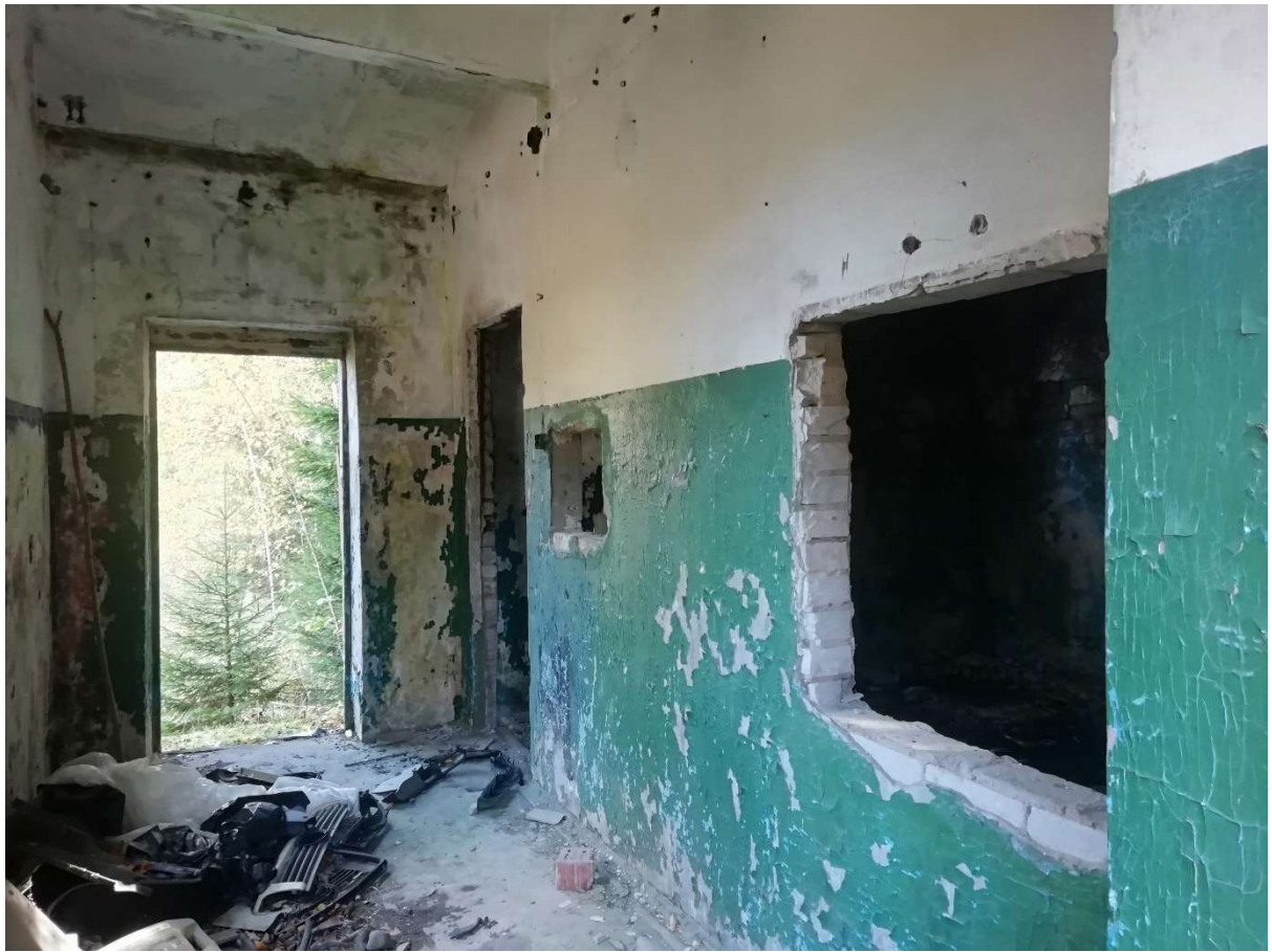
Hoone nr 1 (Vaade hoone sees)