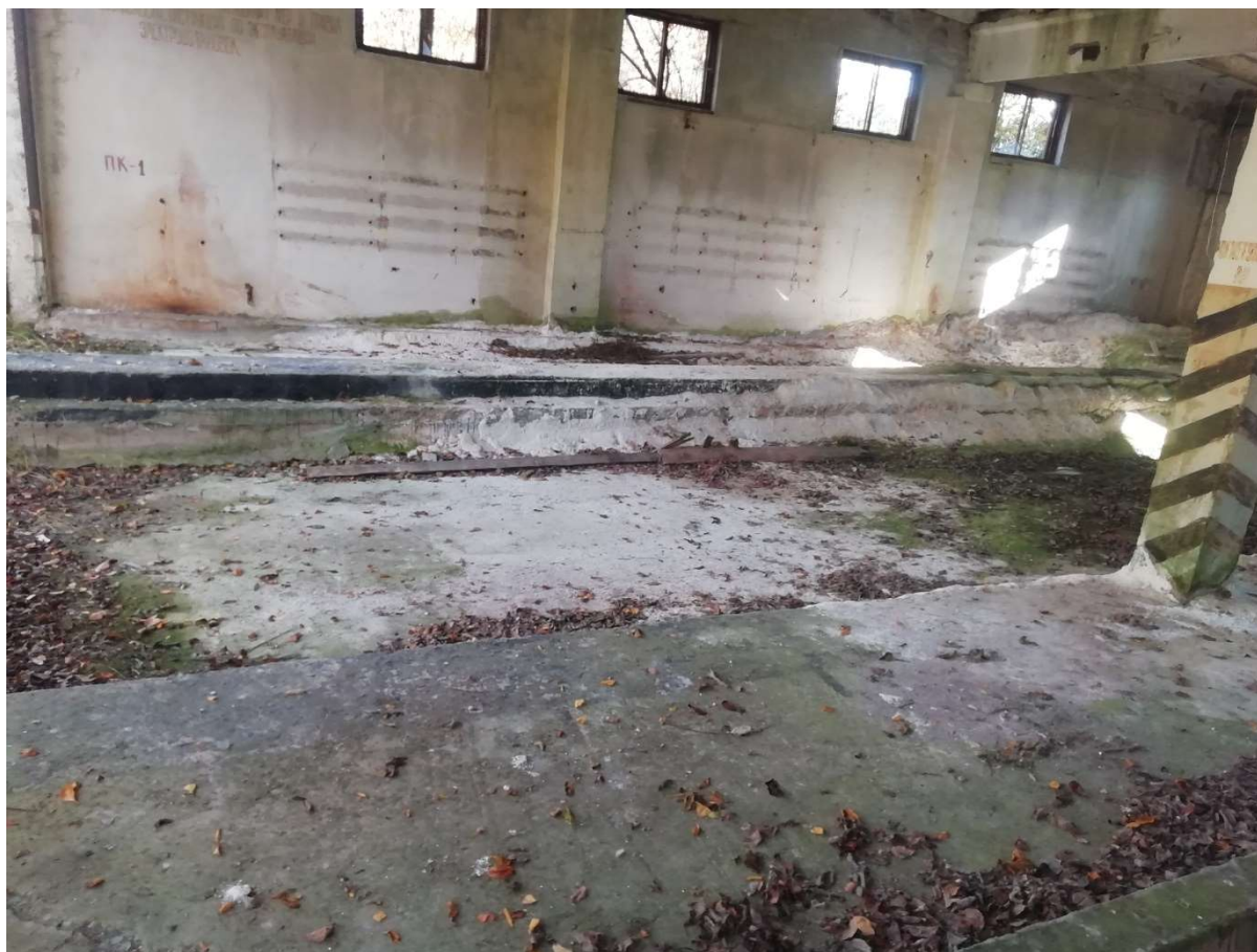
Hoone nr 7 (Vaade betoon põrandale hoone sees)