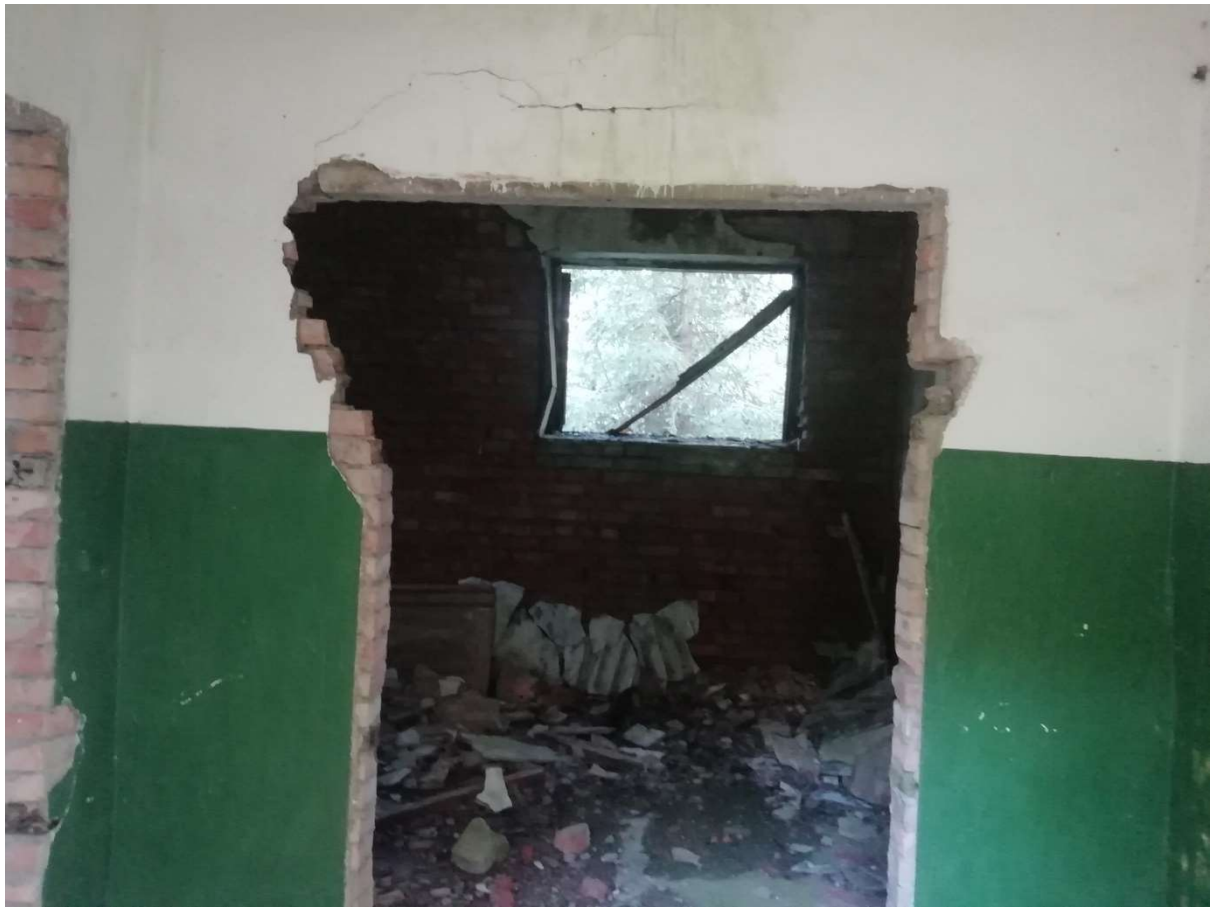
Hoone nr 5 (Vaade hoone seest)