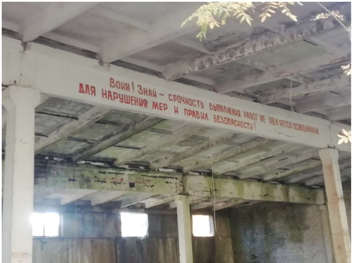
Hoone nr 7 (Vaade hoone sees, katuslae konstruktsioonid)