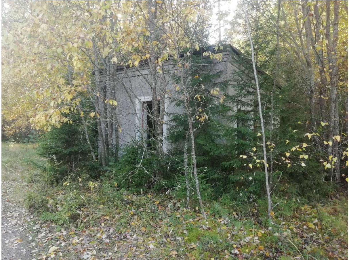
Hoone nr 4 (Vaade põhja poolt.)