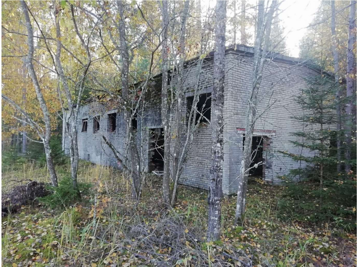
Hoone nr 11 (Vaade hoonele ida poolt)