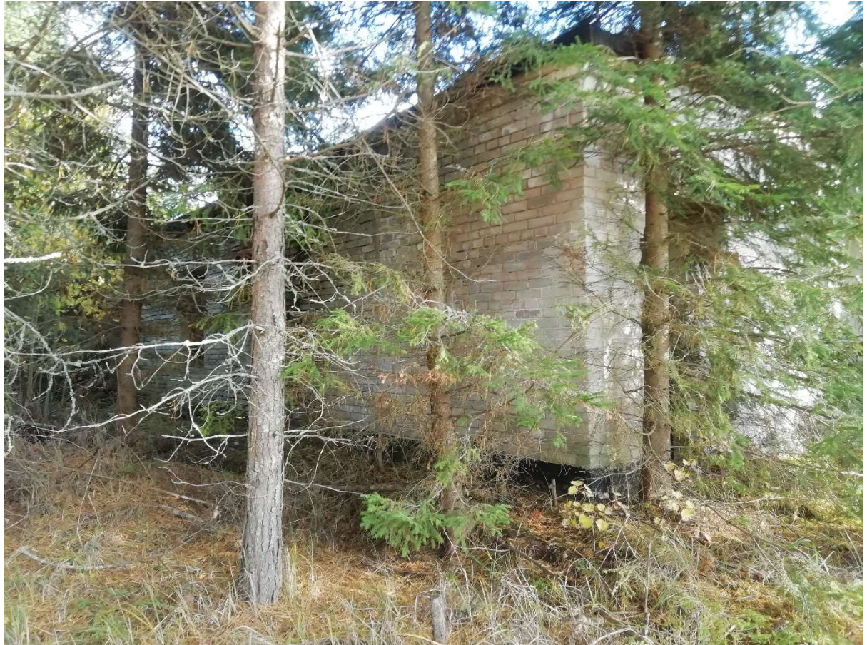
Hoone nr 12 (Vaade hoonele põhja poolt)