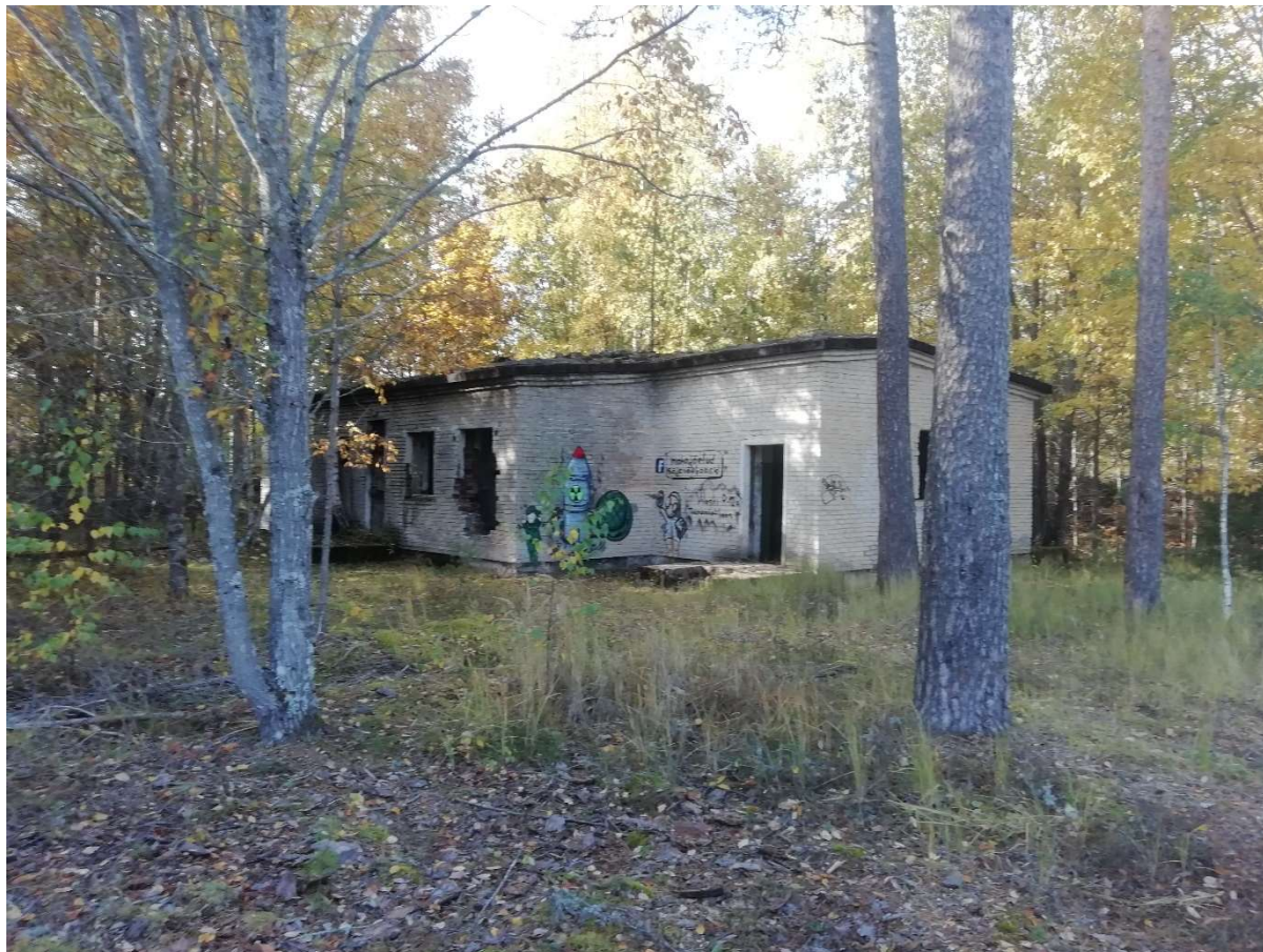
Hoone nr 10 (Vaade hoonele ida poolt)