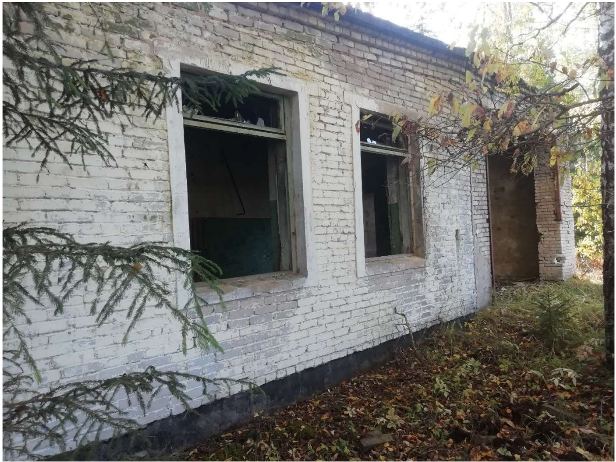
Hoone nr 3 (Vaade põhja poolt.)