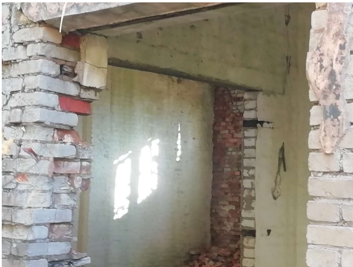
Hoone nr 6 (Vaade hoone sees)