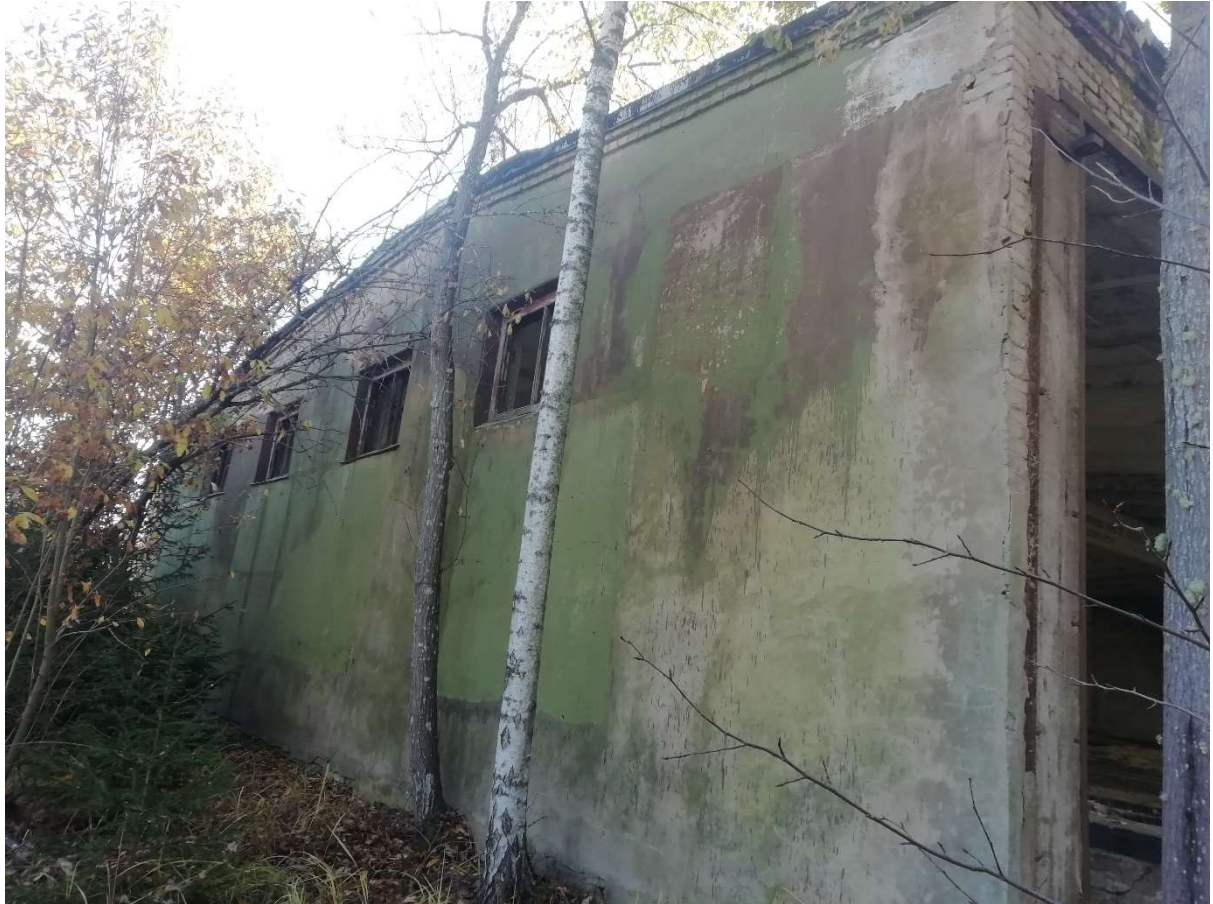
Hoone nr 7 (Vaade ida poolt.)