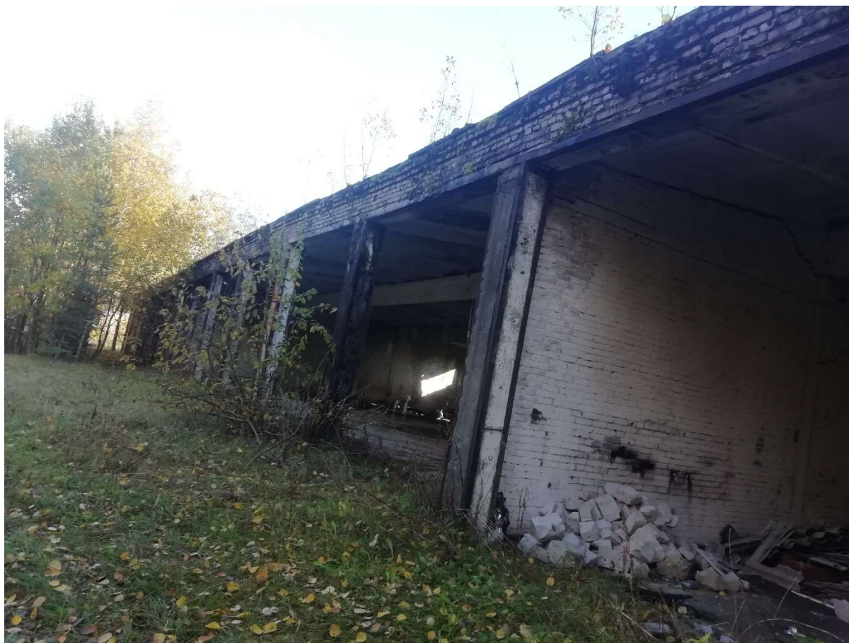
Hoone nr 7 (Vaade põhja poolt.)