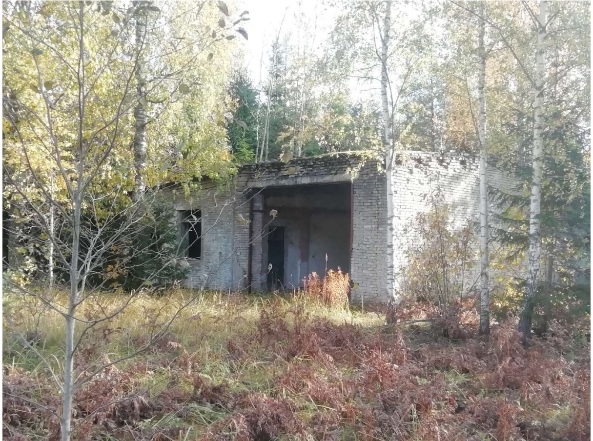
Hoone nr 3 (Vaade põhja poolt.)