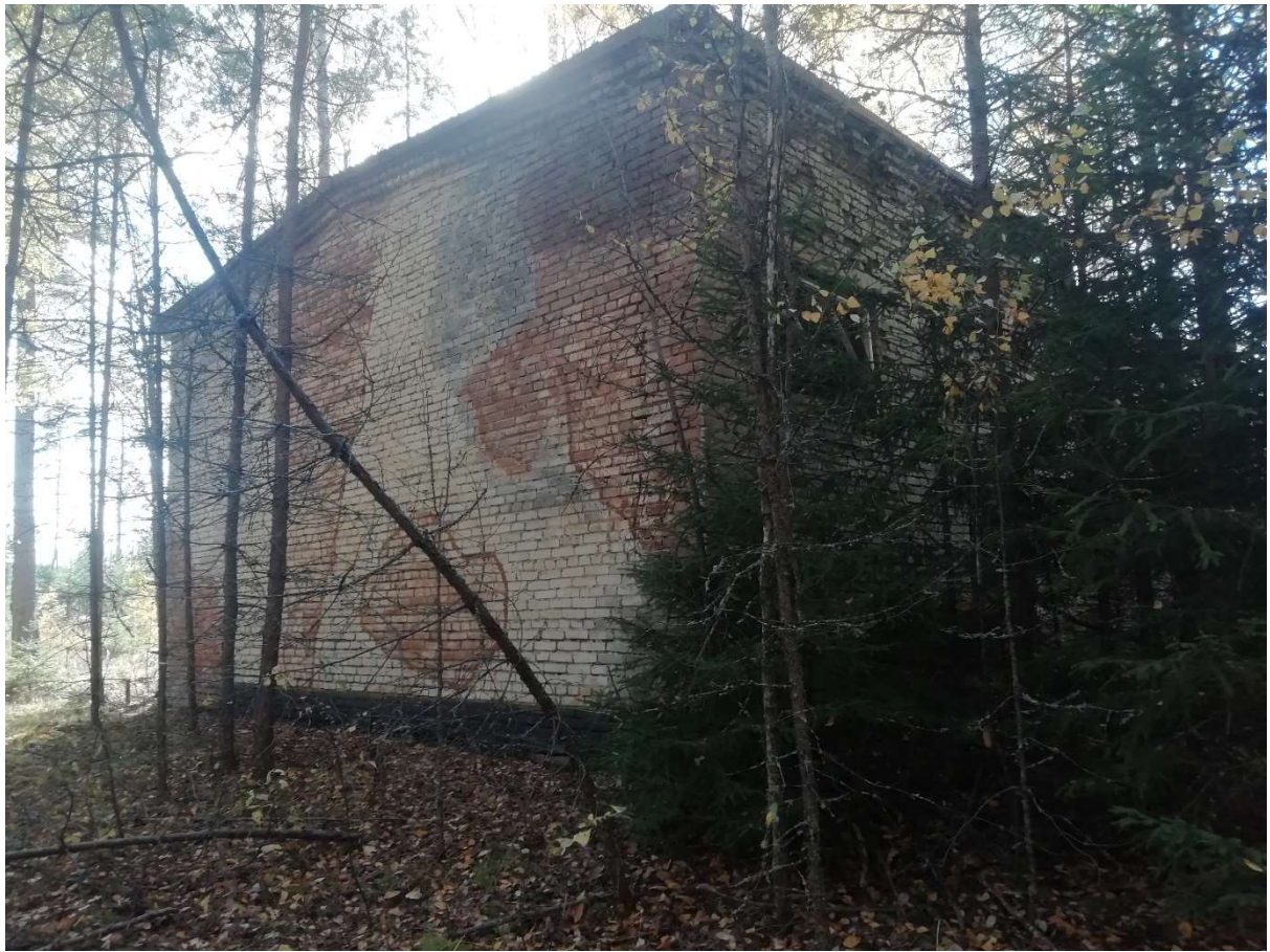
Hoone nr 6 (Vaade ida poolt.)