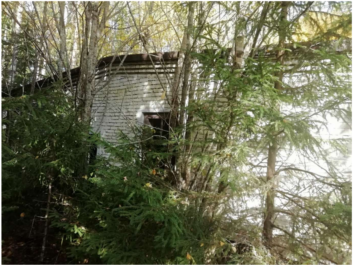
Hoone nr 8 (Vaade hoonele lääne poolt)