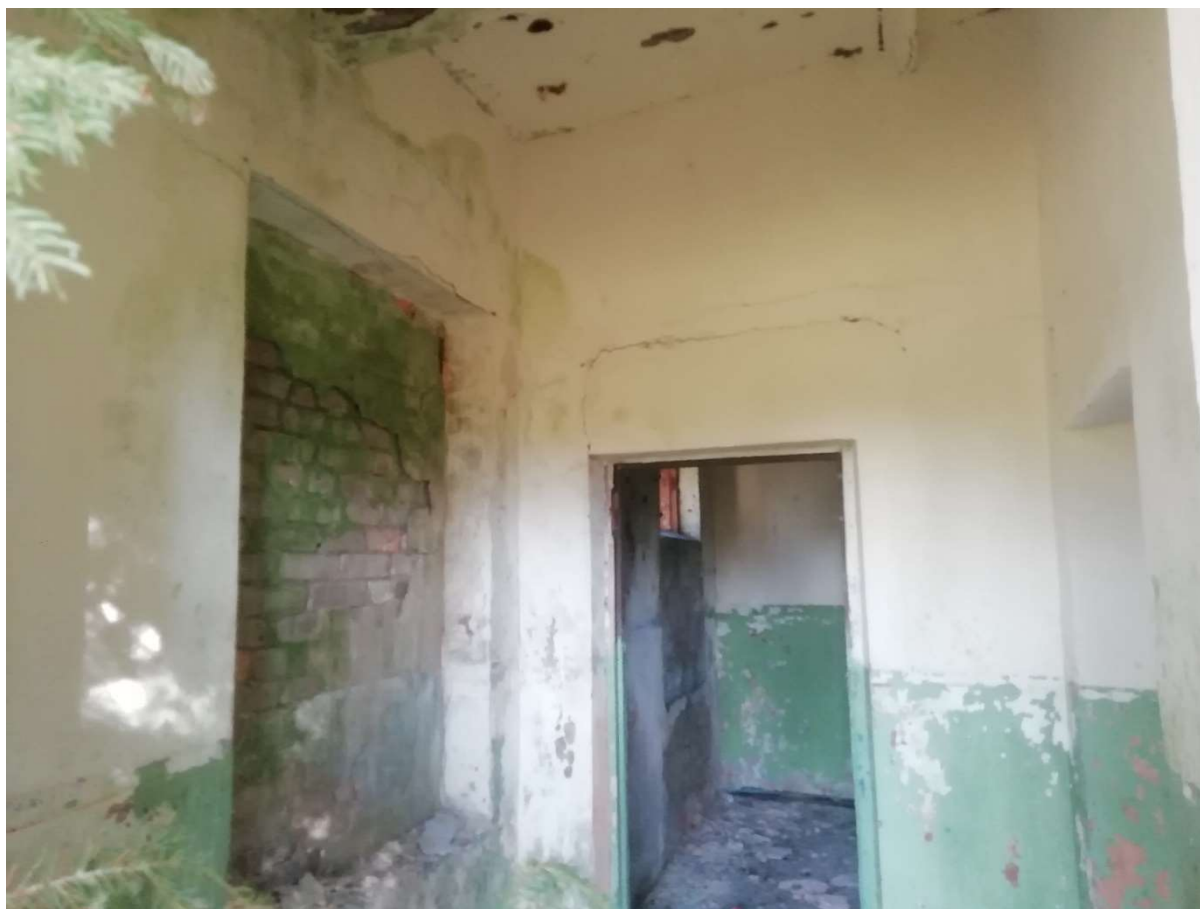
Hoone nr 12 (Vaade hoone sees)