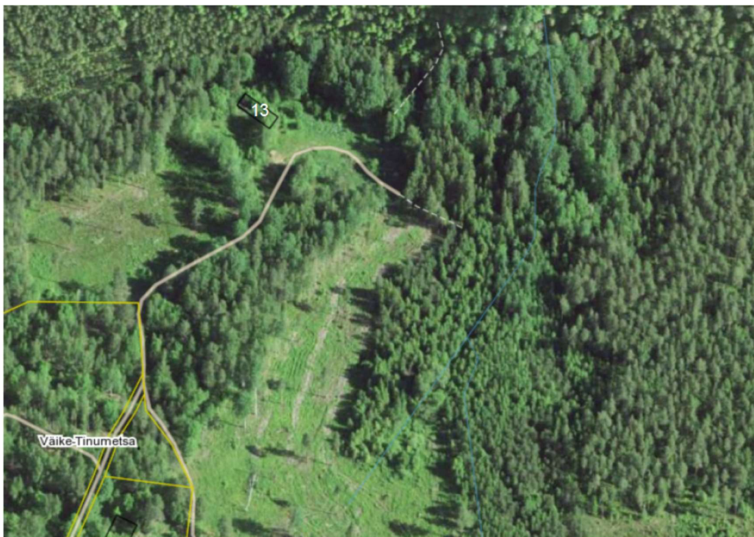
Asendiskeem nr 3.2 (Lammutatavate hoonete numeratsioon 13)

Enne pakkumise tegemist lammutamist teostaval isikul on vajalik kohapeal olukorraga tutvumine ning mahtude ülekontrollimine ja vajadusel lisamine või korrigerimine.