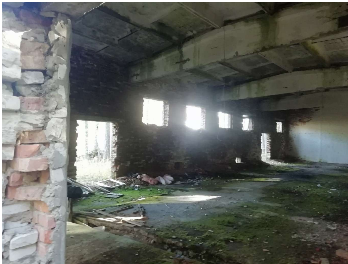
Hoone nr 11 (Vaade hoone sees)