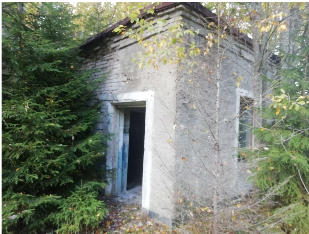
Hoone nr 4 (Vaade lõuna poolt.)