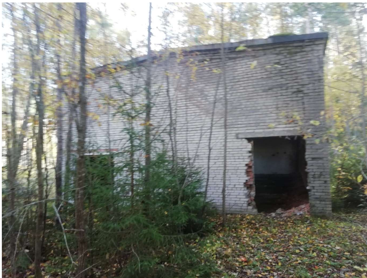
Hoone nr 11 (Vaade hoonele põhja poolt)