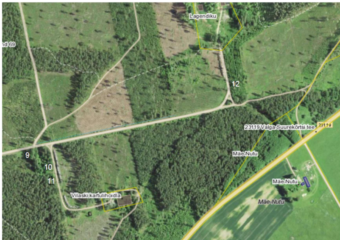
Asendiskeem nr 3.1 (Lammutatavate hoonete numeratsioon 9-12)